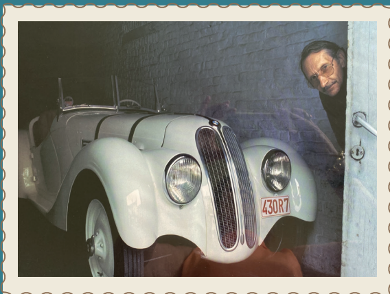
From scratch BMW 328

In het verlengde van een hoop roest en verrotting, doorgezakte veren, ontbrekende koplampen, smerige en gescheurde zetels, onherstelbare banden, een gedeukte carrosserie, een kapot dak, een geblokkeerde motor... is er deze smetteloze auto, alsof hij net uit de fabriek komt!